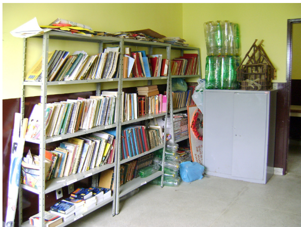
Imagem 07: Biblioteca da SAB

Existem lan houses, bem frequentadas, ou mesmo internet em casa. Como já mencionado, a SAB pensa em montar um laboratório de informática, a escola também tem sua sala de informática pronta, no entanto, faltam os computadores, para que assim a comunidade possa desfrutar do que a tecnologia oferece.